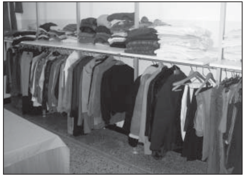
Abiti pronti per la distribuzione nella sede della Comunità di Sant'Egidio