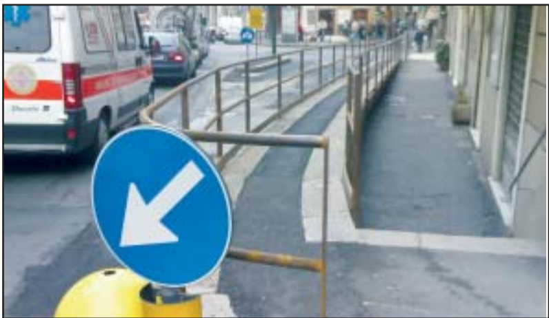
Il nuovo marciapiedi per disabili in via Cantore

Sempre più ormai negli ultimi tempi, parlando di San Pier d'Arena si usano termini come zona di confine, afflitta da numerevoli piaghe, tra queste in quasi tutti i discorsi affiora l'emergenza degrado e sporcizia, che investe vie principali e strade secondarie della delegazione.