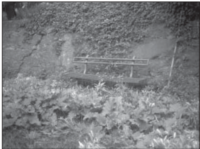
Lo stato d'abbandono dei giardinetti del Fossato

In via San Bartolomeo del Fossato, a monte dei civici dal 62 al 70, esiste un'area verde comunale di pubblico accesso affiancata da alcuni orti urbani. Nell'area comunale è presente una scaletta che collega due tratti sovrastanti della via e che esce, in basso, a fianco del palazzo n. 62. La stessa scaletta dà accesso a un articolato giardino comunale, in cui sono presenti vari alberi, tre panchine e le solite ringhiere basse a delimitazione degli spazi. Ebbene tutto questo verde comunale è da tempo in completo abbandono: la parietaria (quell'erba che in genovese chiamiamo canigiæa) ha invaso tutti gli spazi, le erbacce sono alte e dove non